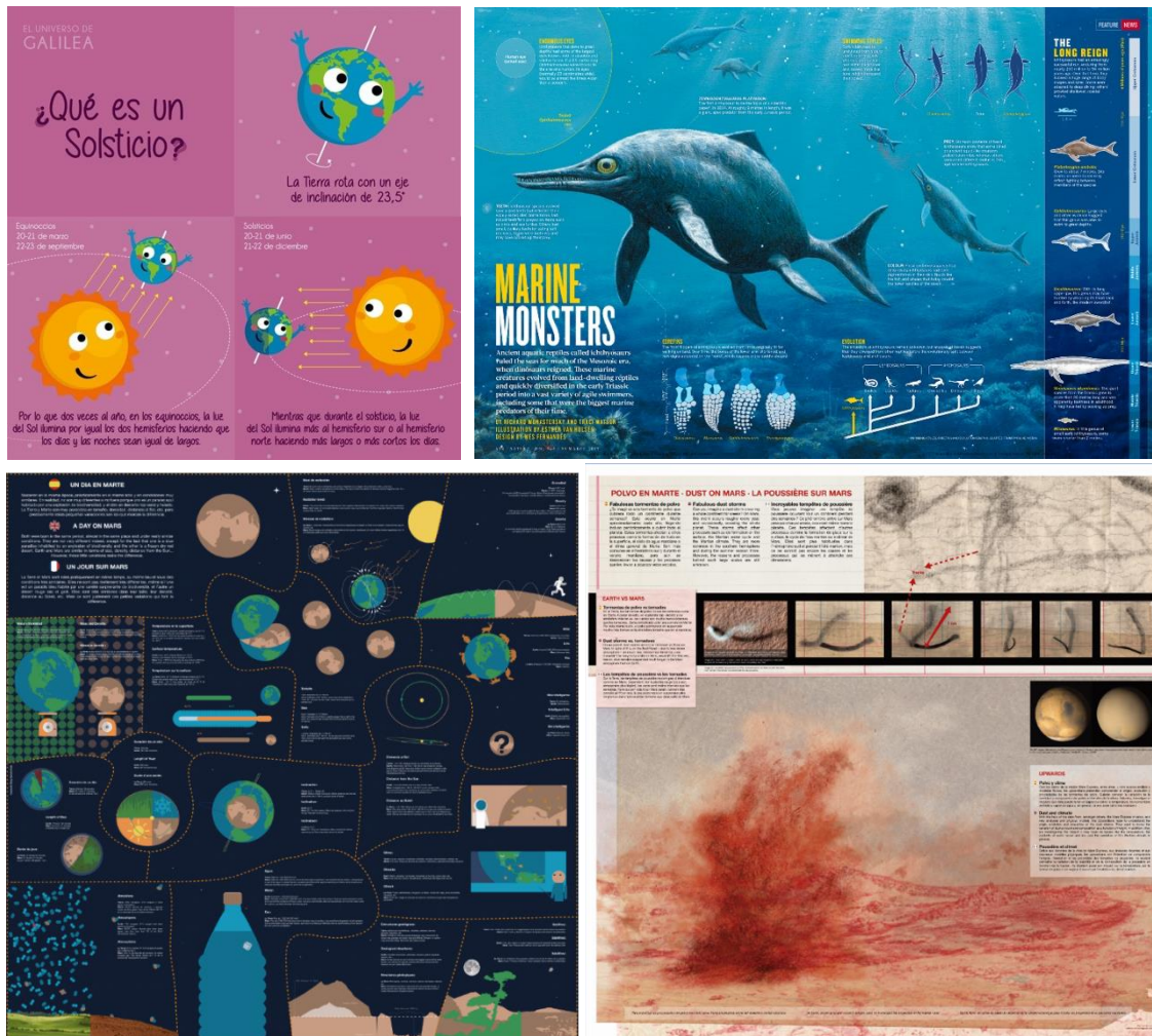
Παραδείγματα: Τι είναι το ηλιοστάσιο; (Universo de Galilea). Θαλάσσια τέρατα (Nature). Μια ημέρα στον Άρη (UPWARDS H2020 project). Σκόνη στον Άρη (UPWARDS H2020 project).

Ένα πληροφοριακό γράφημα (infographic) είναι μια συλλογή εικόνων, γραφημάτων και ελάχιστου κειμένου που παρέχει μια εύκολα κατανοητή επισκόπηση ενός θέματος. Όπως και στα παρακάτω παραδείγματα, τα πληροφοριακά γραφήματα χρησιμοποιούν εντυπωσιακές, ελκυστικές απεικονίσεις για την γρήγορη και σαφή μετάδοση πληροφοριών. Περισσότερα παραδείγματα μπορείτε να βρείτε στην ιστοσελίδα του διαγωνισμού.